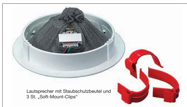
Lautsprecher mit Staubschutzbeutel und 3 St. „Soft-Mount-Clips“

Soft-Mount-Einbaulautsprecher, 10 W ..... SRC-110 mit 100 V-Übertrager, weiß