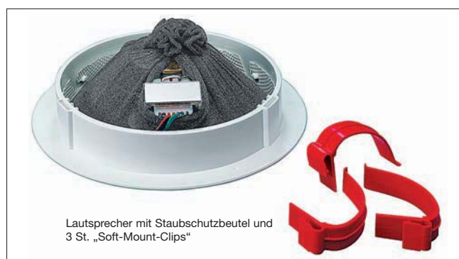
Lautsprecher mit Staubschutzbeutel und 3 St. „Soft-Mount-Clips“