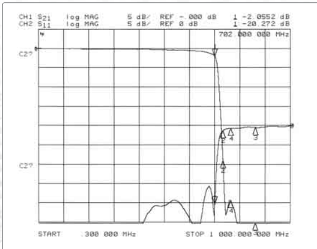
BK 702/734: Durchgangs- und Rückflussdämpfung 0-702 MHz BK 702/734: through loss and return loss 0-702 MHz